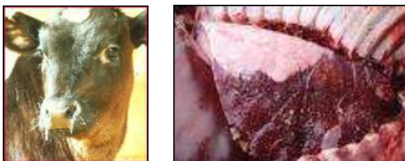
Slika 1, 2: Obolenje dihal pri teletu in videz prizadetih pljuč

Vnetni odgovor na okužbo z različnimi virusi in bakterijami lahko povzroči nepopravljive poškodbe pljuč, ki trajno poslabšajo rast ter zmanjšajo kakovost mesa in ekonomičnost živinoreje. Preprečimo pogine, slabše priraste, zmanjšano konverzijo krme, stroške zdravljenja in neugodno počutje živali s pravočasnim, učinkovitim in enostavnim cepljenjem.